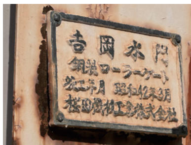
「銘板の表記」には 鋼製ローラーゲート ※扉体を巻き上げる方式の水門 竣工年月 昭和42年3月 櫻田機械工業株式会社

また、歴史の記憶から消えてしまった「櫻田機械製作所」があります。明治 28 (1895) 年創業の一部上場の有力な橋梁メーカーでした。平成 3 (1991) 年広島新交通システム工事での橋桁落下事故(15 人死亡)の補償負担や財務上のデリバティブ損失により法人消滅しました。東砂 2 丁目の工場跡地は、「都営東砂二丁目アパート 1,487 戸」(5ha)となっています。当社の名は、細やかに江東区平野 3 丁目の深川北スポーツセンター脇にある「福富川公園」入口の「吉岡水門」の遺構にあります。福富川の水門の役割は終わりましたが、水門(製造者が当社)上部構造が保存され、公園のモニュメントとして遺されています(写真)。