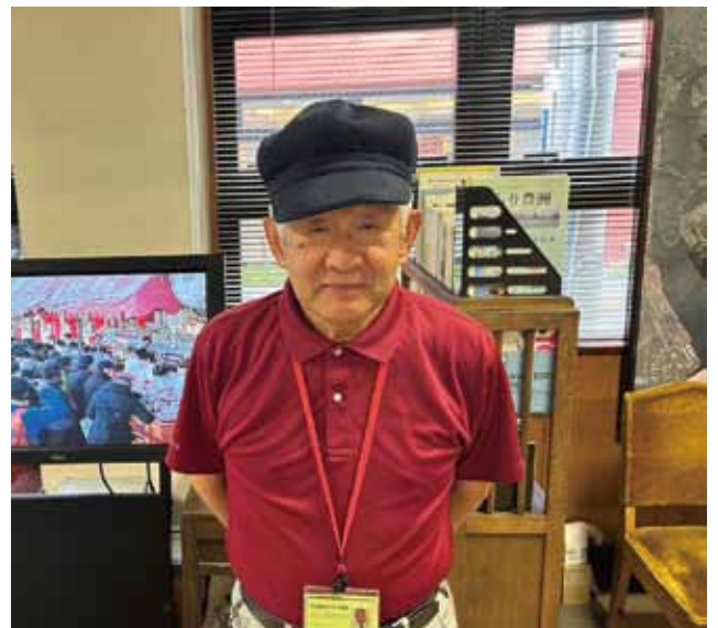
(文と写真 江東区文化観光ガイド 中尾 正文)

深川東京モダン館では江東区文化観光ガイドによる館内のご案内（10時～16時）およびご希望によりモダン館周辺のまちあるきツアー（1時間程度、11時・14時出発）を行っています。 ※諸事情によりガイド不在の場合もあります。