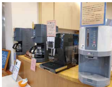
百圓珈琲は2月末より毎回持ち手の消毒を行ってご提供しています

本来であれば、今年はオリンピックイヤーということで7月から9月までは東京を中心に各所で競技が開催され、多くの人々が訪れたことでしょうか、来年に延期となりました。まだまだ予断を許さない状況であり、観光案内所であり文化施設でもある当館がどのようなことが出来るのかを手探りしながらすすめていきたいと思います。