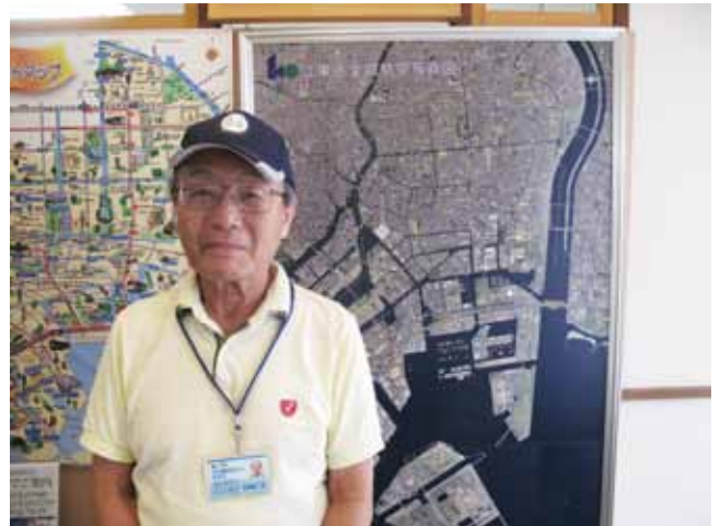
（文 江東区文化観光ガイド 日紫喜 一史）

深川東京モダン館では、江東区文化観光ガイドによる館内のご案内（10時～16時）およびご希望によりモダン館周辺のまちあるきツアー（1時間程度、11時・14時出発）を行っております。 ※諸事情によりガイド不在の場合もございます。