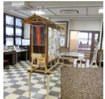
もみがらエコボード→

ちなみに、モダン館 1 階中央にある「モダン館掲示板」は、コルクボードでなく「もみがら」を圧縮したものが使用されています。これは「米どころ」秋田県の建設会社が、稲刈り後に出る「もみがら」の有効利用を図るために開発されたものです。それまでであれば、焼却するしかなかった「もみがら」に新たな命を吹き込んでリサイクルするというのは日本人独特の発想ではないでしょうか。いよいよ夏本番、まちあるきには厳しい季節になってきますが、是非モダン館で一休みして行って下さい。