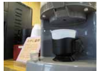
「ひやし珈琲」はじめました

モダン館では、暑くなってくると1階カウンターで提供している「百圓珈琲」に「ひやし珈琲」が加わります。氷は使用しませんが、ちょうど飲み頃の冷たさでご提供していますので、是非お試し下さい。梅雨前の気持ちよい気候を満喫する上でも、午前・午後に出発するモダン館のガイドさんを頼りに門前仲町周辺のまちあるきを楽しんでみてはいかがでしょうか。