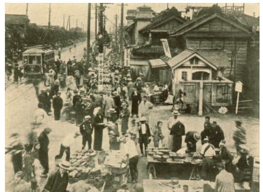
深川区黒江町の魚河岸(大正年間)