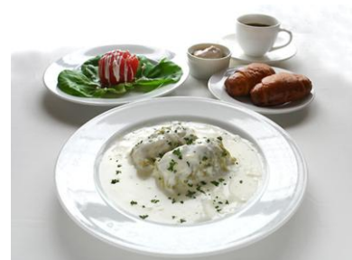
写真は5月開催分「ロール、キャベージ」です