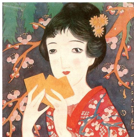
『婦人グラフ』の表紙絵 (1926年)